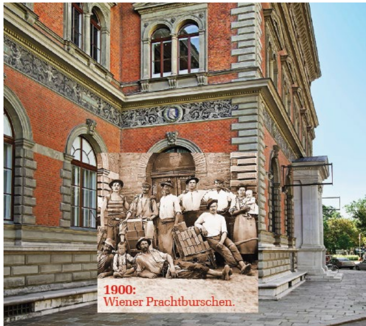
1900: Wiener Prachtburschen.